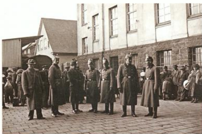
Deportation von Sinti und Roma aus Remscheid nach Auschwitz-Birkenau im März 1943 [Abb. 61]