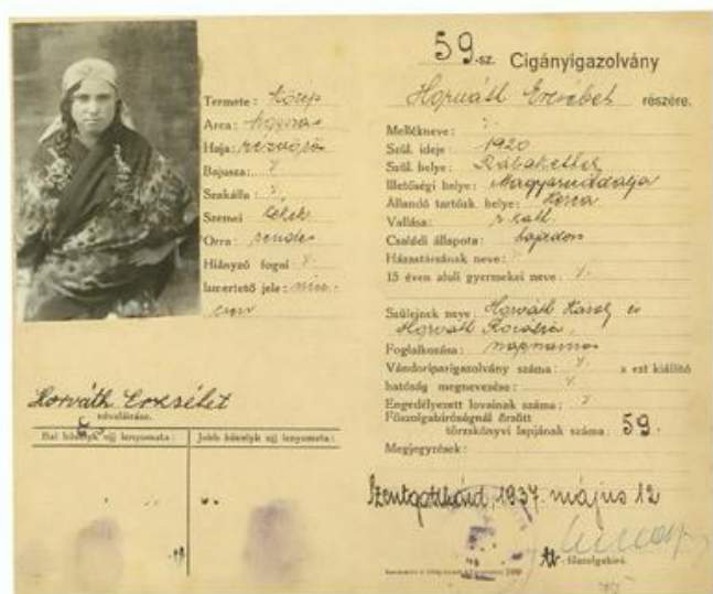
Ausweis mit Fingerabdrücken einer Romni aus Ungarn [Abb. 60]