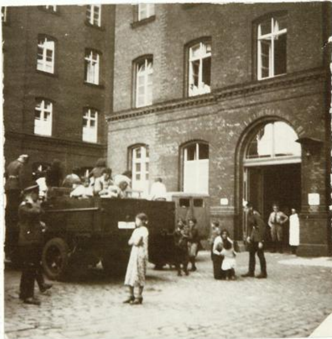
Zigeunerschub von der Westgrenze/ Rheinland“ [Abb. 59]

Die systematische Erfassung der Roma und Sinti durch die „Rassenhygienische und Bevölkerungsbiologische Forschungsstelle“ im Reichsgesundheitsamt war ein wesentlicher Baustein der Rassenpolitik des NS-Regimes. Unter der Leitung von Dr. Robert Ritter zielte sie darauf ab, soziale Merkmale vermeintlich genetisch zu begründen und eine pseudowissenschaftliche Grundlage für die Verfolgung zu schaffen.