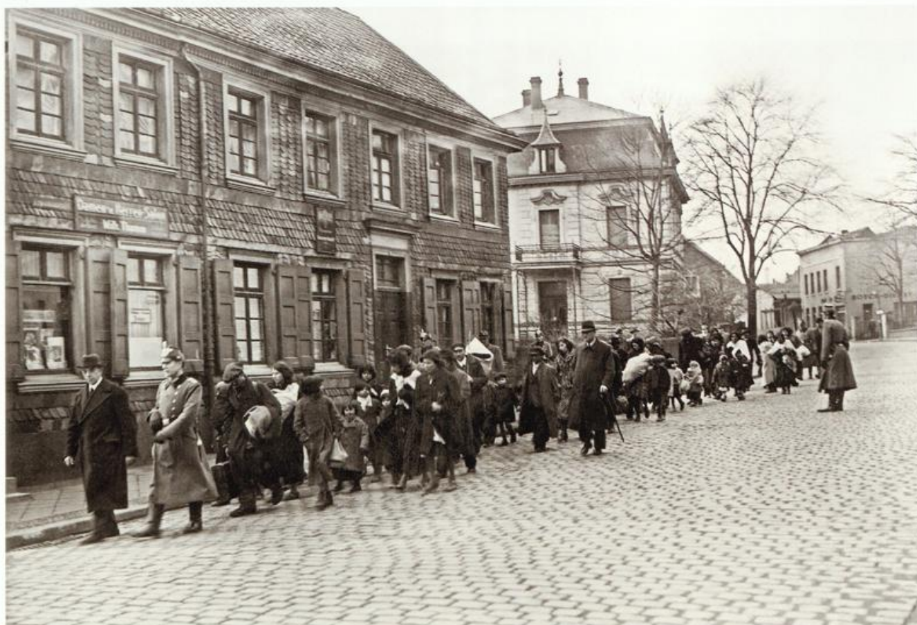
Abb. 64: Deportation von Sinti und Roma aus Remscheid nach Auschwitz-Birkenau im März 1943 [Abb. 62]